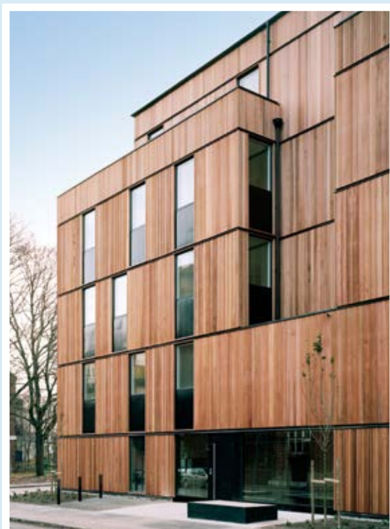
Skagershuset i Årsta.