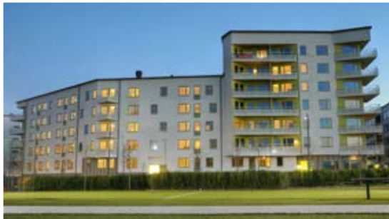
Trollskogen i Annedal.