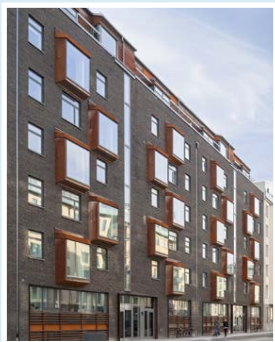
Kv. Abisko, Norra Djurgårdsstaden.