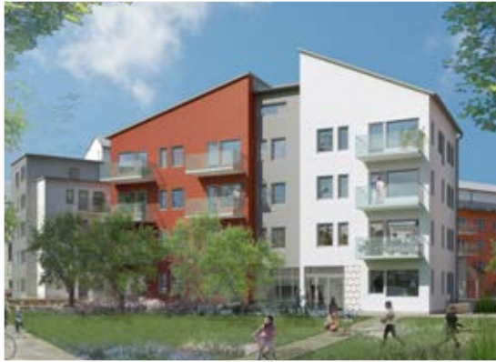
Porslinshusen i Gustavsberg.