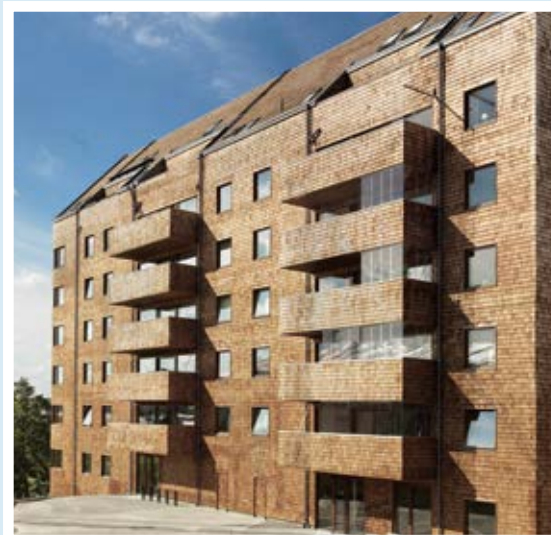
Strandparken, Sundbyberg, världens högsta riktiga trähus. Här har vi sparat in 6000 ton koldioxid åt invånarna i Sundbyberg.