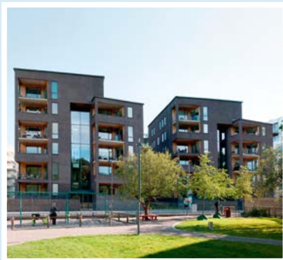
Kv. Abisko, Norra Djurgårdsstaden.