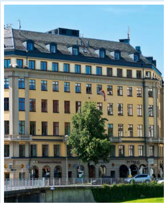
Kv. Drabanten 2, Kungsbroplan.