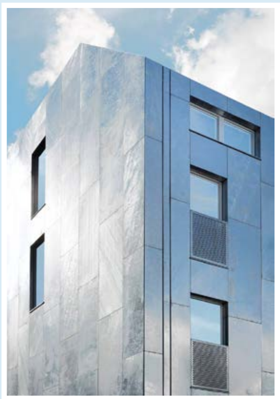
Kv. Tappen, Annedal.