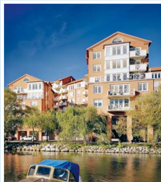
Kv. Tranebergs Strand 1, Alvik.