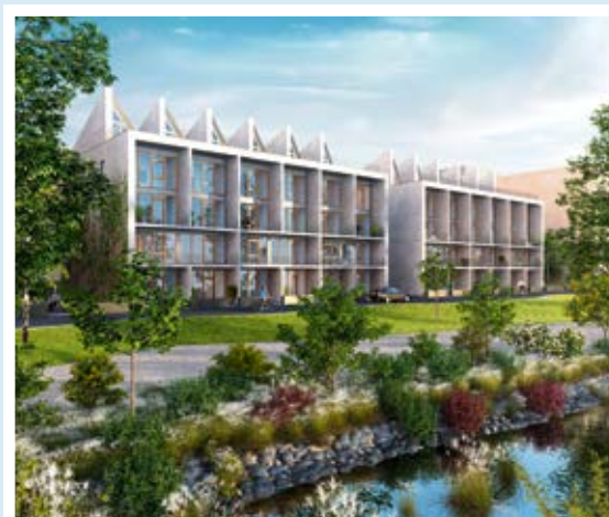
Brf. Strandparken, Norra Djurgårdsstaden.