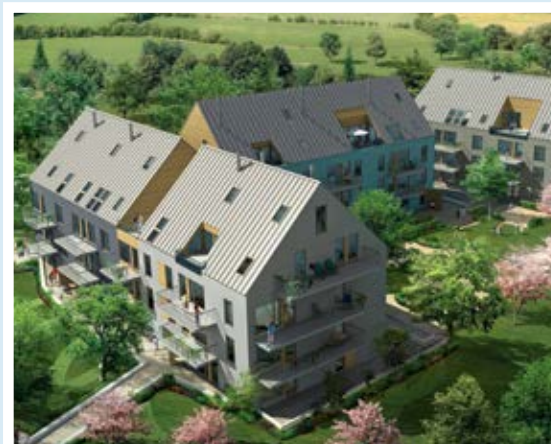
Ösby Park i Djursholm.