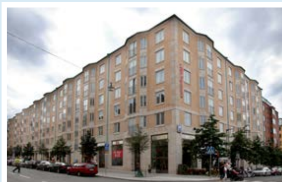
Kv. Loka Brunn, Sabbatsberg.